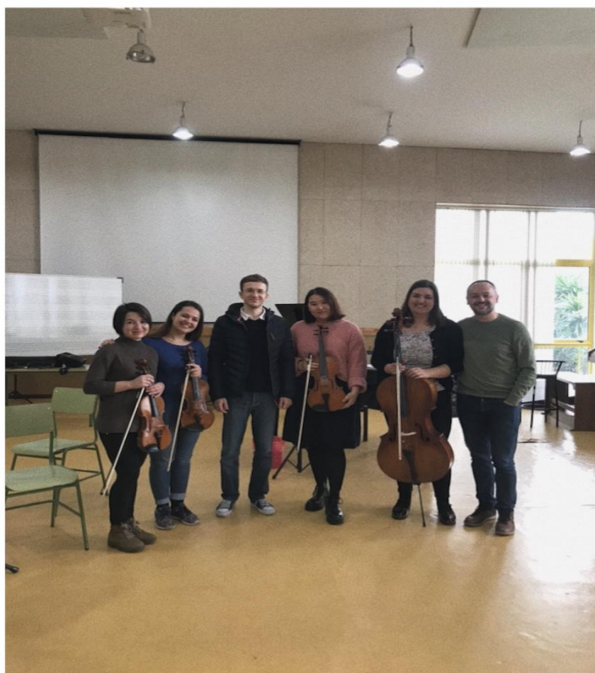
Фото 3. Студенты КНК в Консерватории Виго, после занятий