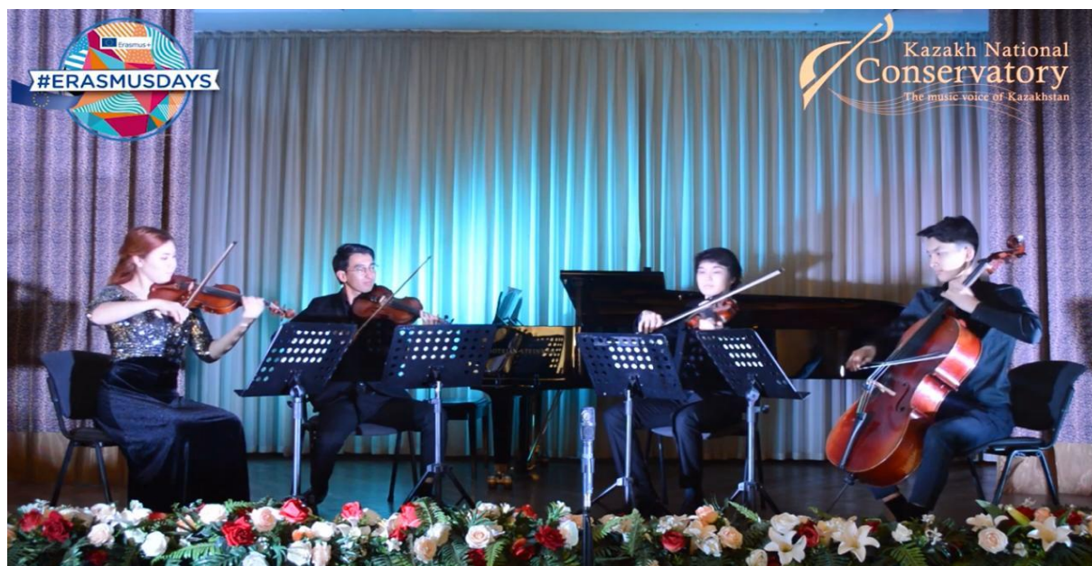
Фото 1, 2. Сотрудники международного отдела совместно с отделом концертной деятельности организовали онлайн концерт, посвященный Международному дню Эразмус+, где основными участниками было студенты КНК, обучавшиеся по академической мобильности в вузах-партнерах дальнего зарубежья