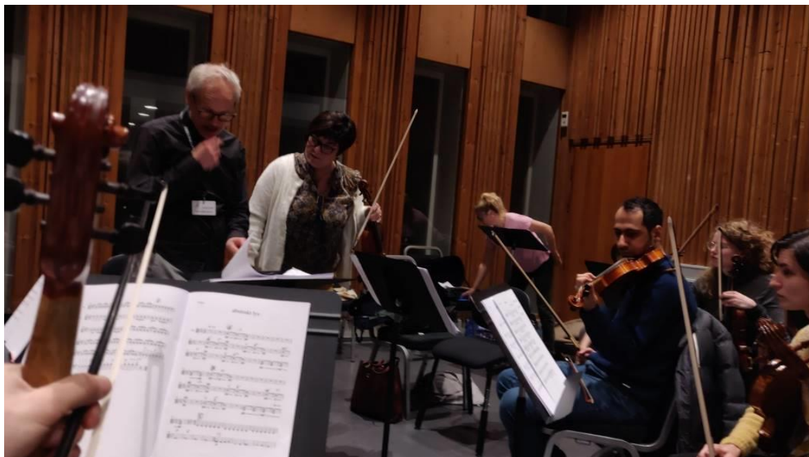
Фото 1. Студенты КНК в Норвегии. Подготовка к концерту 01.02.2020 совместно с Бергенским Филармоническим камерным оркестром (BUCO)