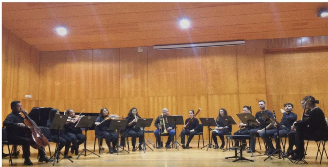
Фото 1. Студенты КНК в Консерватории Вигго, подготовка к совместному концерту.